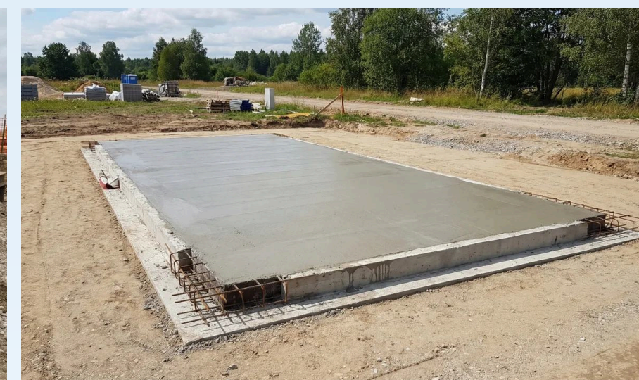
Фундаментная монолитная плита