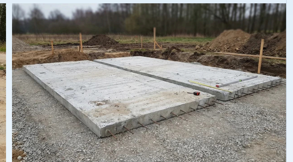
Фундамент из дорожных плит